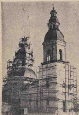
ПАМ'ЯТКА АРХІТЕКТУРИ XVII СТОЛІТТЯ — МИКОЛАЇВСЬКА ЦЕРКВА В МІСТІ ГЛУХОВІ.