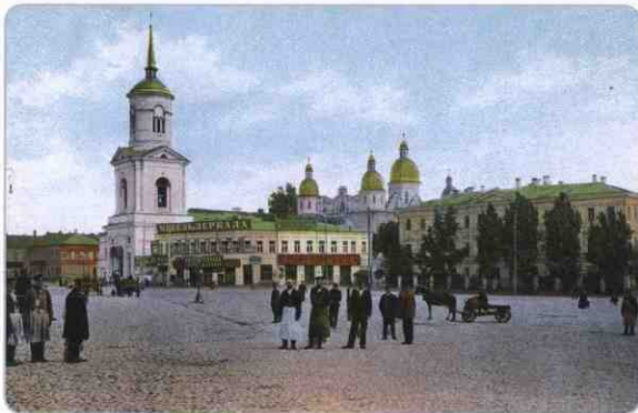
Братский монастырь и Духовная Академия. Le monastère Bratsky et l'Académie des sciences théologiques.