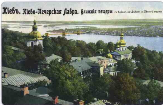
Киев. Киево-Печерская Лавра. Ближние пещеры с видом на Днепр и Цепной мост