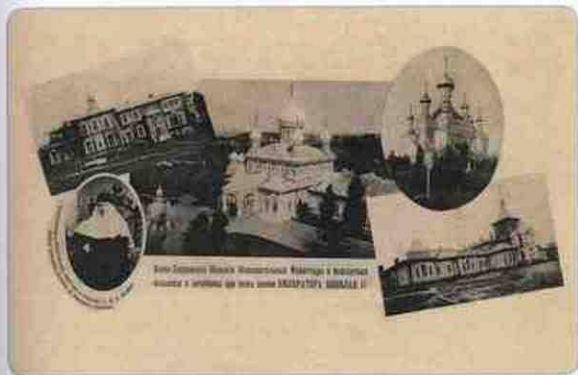
Киево-Печерский женский общежительный монастырь и бесплатная лечебница при нем имени императора Николая II