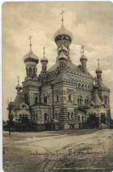
Главный храм Покровского женского монастыря