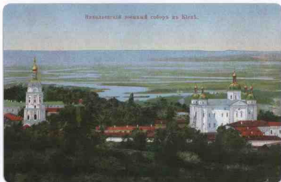
Николаевский военный собор из Киева.