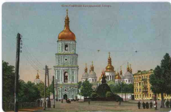
Киево-Софийский кафедральный собор

Это древнейший из всех сохранившихся храмов Украины. Практически сразу после своего возведения он стал легендой. Им восхищались и зарубежные послы, и простые люди, а богомольцы преодолевали сотни километров, чтобы посмотреть на него. В его стенах нашли последнее пристанище десятки правителей и высших иерархов Церкви, еще больше деятелей было здесь отпето. Софию Киевскую поистине можно назвать сердцем нашего народа.