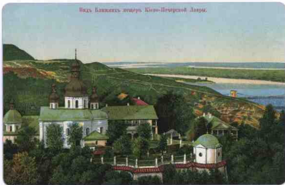
Вид Ближних пещер, Киево-Печерской Лавры.