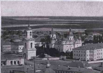
Kiev в 70-х гг. XIX в. Kief il y a trente ans.