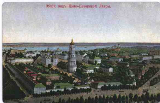
Общий вид Киево-Печерской Лавры.

К сожалению, от тех укреплений не осталось практически ничего — они были до основания разрушены в ходе длительной осады Киева ордой Батия в 1240 году. Только в середине XX века археологам удалось раскопать часть валов, опоясывавших монастырь в древности. Но даже этой находки хватило, чтобы подтвердить факт их существования и получить представление о них. Исследования пока-