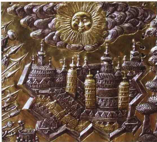
Батуринська фортеця (1695). Фрагмент шати кіота ікони Іллінської Богоматері. Чернігівський історичний музей ім. Василя Тарновського.

розкопок. Водночас на зображенні шати є подробиці, які підтверджують результати останніх.