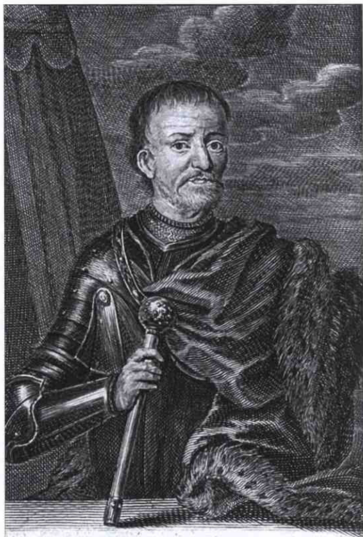
Гетьман Іван Мазепа, Бернігерот Мартін, 1706

Johannes Mazepa, Casaccorum Zaporoviensium Supremus Belli-Dux.