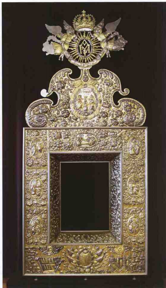
Шата кіота чернігівської ікони Іллінської Богоматері. Чернігівський історичний музей ім. В. Тарновського.