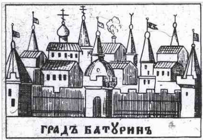
Батури. Лубок. XVIII ст.

У той же час у кінці XVIII ст. у Батурині розібрали так званий Мазепин стовп (явно кам'яну башту!), з котрого пізніше «одержано декілька тисяч пудів заліза і стільки ж цегли, що було достатньо для побудови церкви» 24 . Зауважимо, що у XVII ст. оборонні вежі ще називали й «стовпами» 25 . Вони зводилися всередині фортеці для спостереження за округою 26 . Володимир Коваленко вважав, що «Мазепин стовп» — дзвіниця собору Живоначальної Трійці 27 . Проте з цим важко погодитися, оскільки навряд чи б церковна споруда отримала б нове ймення. Тим паче, що уцілілі жителі передали б своїм