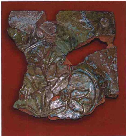
Кахля печі з кімнати Мотрі в будинку Кочубея.

При цьому на графічному зображенні Чернігова контури трибанного Спаського собору не збігаються із його контурами на іконі Єлецької Богоматері (1690-ті). У «Граде Києве» з усіх будівель розпізнається лише Успенський собор (ліворуч від центральних воріт фортеці). Десь приблизно таким його зображали на гравіюрах 1680-х років 45 . Тобто ці міста в «Описании» дещо схематичні, вони дають лише часткове уявлення про головні ознаки населених пунктів.