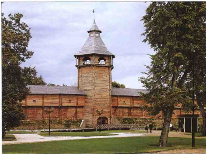
Головна в'їзна чотирирярусна вежа Цитаделі Батуринської фортеці. Висота — 28 м. Реконструкція 2008 р.