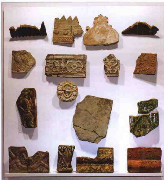
Фрагменти кахлів XVII-XVIII ст. Музей археології Батурина.

Можливо, на шаті бачимо оновлені оборонні споруди, обмазані глиною. Хоча припускаємо, що у 1692 р. ремонтувалися насамперед башти «Большого города» 20 , тобто ті, які стояли на зовнішньому валу фортеці.