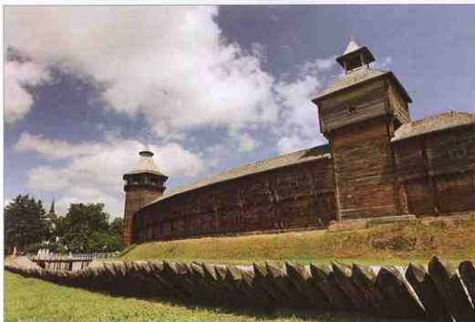
Цитадель Батуринської фортеці. Реконструкція 2008 р.