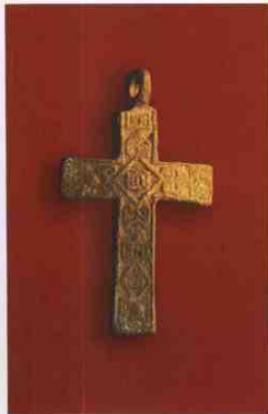
Хрестик XVII–XVIII ст., віднайдений у Батурині.

Підсумовуючи сказане вище, зазначимо, що відкрите нами зображення Батуринської фортеці на кіоті ікони Іллінської Богоматері дає поштовх для подальших археологічних пошуків певних споруд на території колишньої гетьманської столиці, а також нових розвідок архітекторів та істориків.