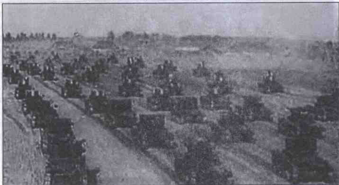
Вступ Червоної армії в Західну Україну

«Визволення» Західної України у вересні 1939 року, організація тимчасових управлінь, вибори депутатів до Народних Зборів проходили за одним сценарієм — замаскувати підступний акт більшовицької анексії, антиморальний і незаконний злочинний акт Молотова-Ріббентропа, який мав агресивний характер і тепер за міжнародним правом засуджений.