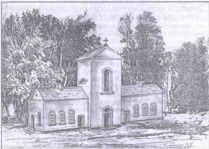
Реконструкція замку, зроблена за спогадами Попика Миколи, Стельмаха Василя, Гльчук Марії, Стадника Павла. Автор – Бердюк.

Визвольна боротьба під проводом Богдана Хмельницького дійшла й до наших міст і сіл. Так, у 1648 році загони Максима Кривоноса на синьовецько-білецьких полях (5 км від Вербівця) розгромили війська шляхтича Яблонського. Козаки насипали своїм полеглим побратимам високу могилу (тепер там каплиця). Такі могили були насипані і у Вербівці, біля лісу, за Підляшшям, і – на Загороді. На жаль, їх розорали в радянські часи тракторами, незважаючи на те, що це – наша історія.