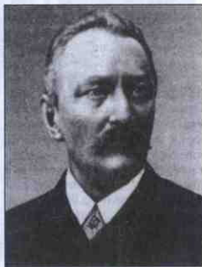
Анатолій Вахнянин, галицький діяч, письменник, композитор, засновник «Просвіти»

У селах Кременецького повіту, до якого належала і Лановеччина, було відкрито 90 читалень «Просвіти».