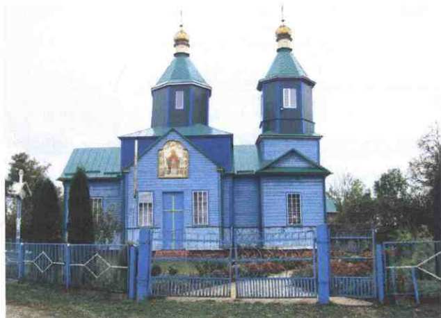
Церква Святого Георгія Побідоносця