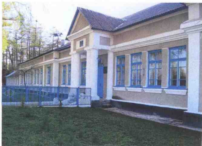
Катеринівська загальноосвітня школа I – II ступенів