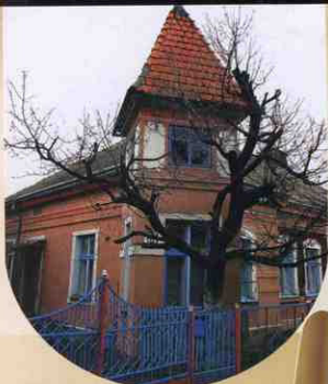
2015 рік. Архітектурні окраси міста. Будинок на вул. Зеленій.