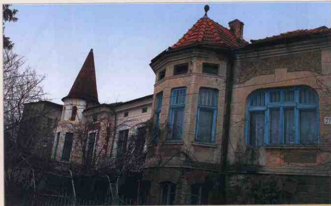
2015 рік. Архітектурні окраси міста. Будинок на вул. Зеленій.

Коли прийшов час, щоб повертати банкам позики за будинки, почалася катастрофа. Рейвах. Гвалт. Той, хто міг врятуватися чи вхопити сто ринських, втік до Америки. Решта вмирає з голоду, мліє у невіданні. А Новий Чортків стоїть. Його вулиці сумні. Ця частина міста майже вся