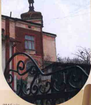
2015 рік. Архітектурні окраси міста. Будинок на вул. С. Бандери.