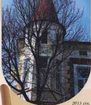
2015 рік. Архітектурні окраси міста. Будинок на вул. Зеленій.