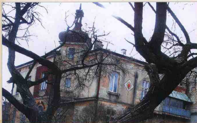
м. Тернопіль.

2015 рік. Архітектурні окраси міста. Будинок на вул. С. Бантери.