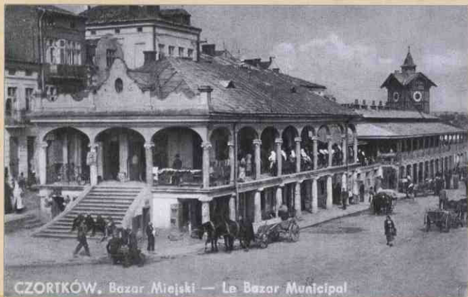
CZORTKÓW. Bazar Miejski — Le Bazar Municipal

1928 рік. Міський базар в усі пори року був людиним.