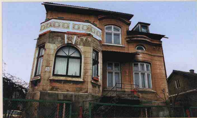
2015 рік. Архітектурні окраси міста. Будинок на вул. Зеленій.