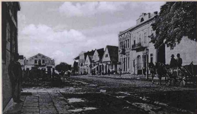
1895 рік. Такою була площа Ринок до будинкового буму.