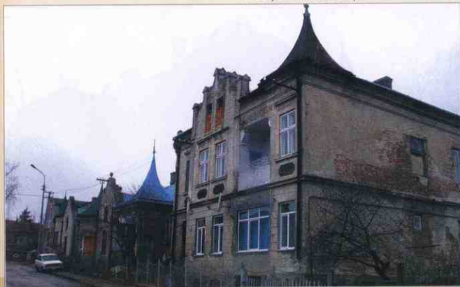
2015 рік. Архітектурні окраси міста. Будинок на вул. І. Франка.