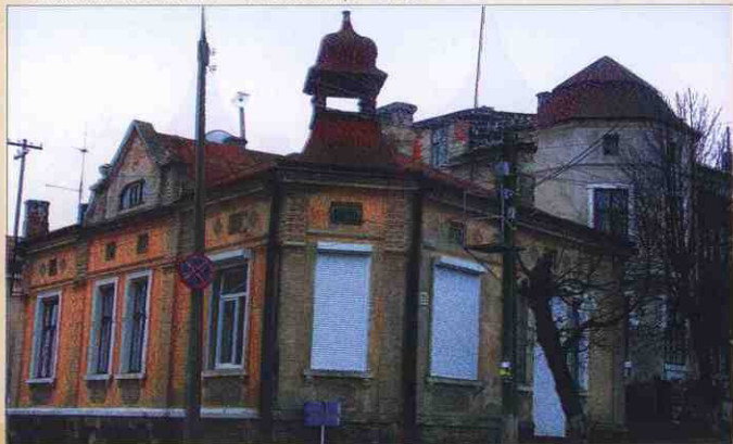
2015 рік. Архітектурні окраси міста. Будинок на вул. Пігути.