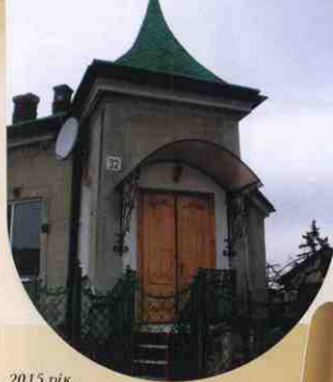
2015 рік. Архітектурні окраси міста. Будинок на вул. І. Франка.