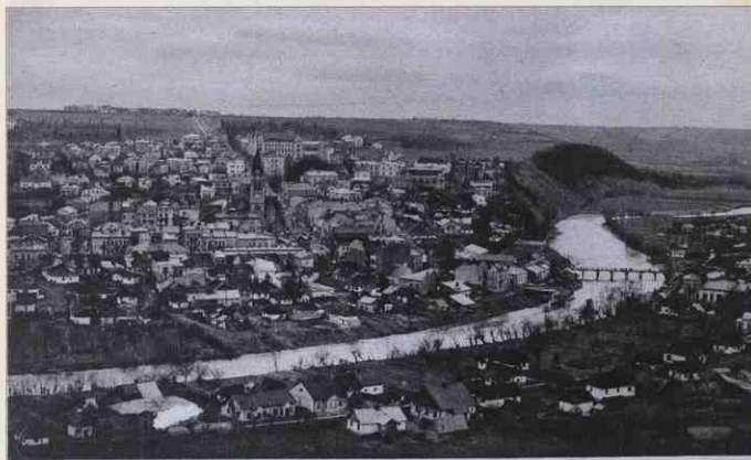
CZORTKÓW. Widok ogólny. Vue générale.

Копія листівки з колекції Вікторії Пахомок, м. Чортків.