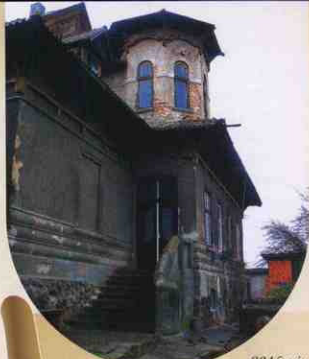
2015 рік. Архітектурні окраси міста. Будинок на вул. І. Франка.

О, Моня! Як, ви не відаєте, хто такий Моня? То велика людина. Талант.