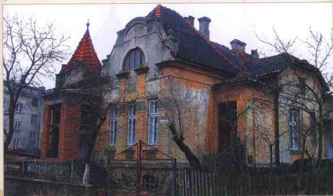
2015 рік. Архітектурні окраси міста. Будинок на вул. І. Франка.

Ще одним фактором, що довершив руйнацію старого середньовічного чортківського замку і верхньої частини замкової площі, стало зведення нового домініканського костелу та швидка забудова на початку двадцятого століття так званого Затилуку (в документах, у тому числі і в грамотах Стефана Потоцького 1722 року, Затилком називали частину міста, яка розташовувалася за замковою площею, на її затилку. (Чит. грамоту Стефана Потоцького на стор. 589).