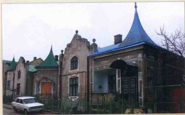
2015 рік. Архітектурні окраси міста. Будинок на вул. І. Франка.

Чортківські євреї були в повному захваті від новини. Неприхована радість перла з їхніх грудей так