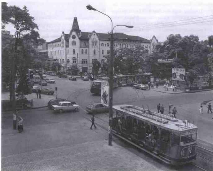
Гостиница «Украина» в Днепре в наши дни.