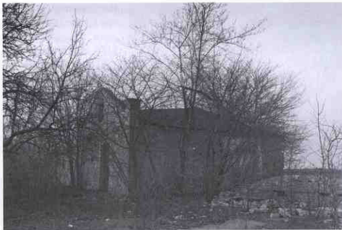
Улица в с. Ивановка Магдалиновского района в наши дни.