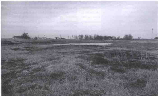
На месте бывшего имения Любин Кут.