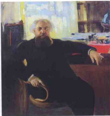
Адріан Прахов. Портрет роботи О. Мурашка

Найбільш оригінальну і відносно добре збережену частину розписів південної апсиди із сюжетами з життів Св. Кирила та Св. Афанасія Александрійських Прахову вдалося відстояти як таку, що не може поновлюватися й має залишатися у тому ви-