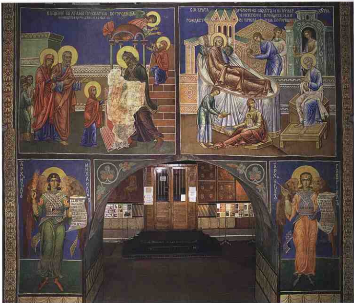
Розпис західної стіни центральної нави

створення нових розписів мали бути залучені професійні художники. Бюджет робіт не давав можливості запросити знаменитостей (всього треба було розписати більше 7548 квадратних аршинів стін, при цьому розцін-