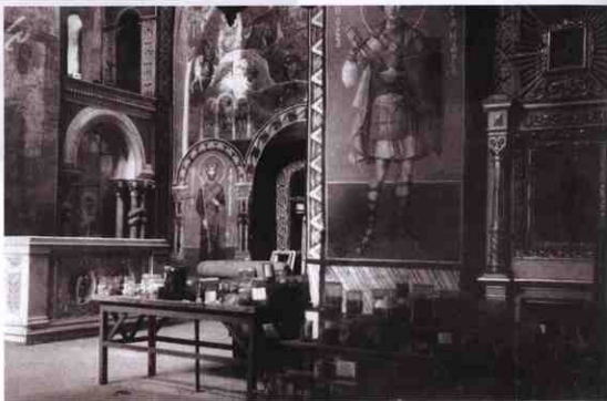
Интер'єр Кирилівської церкви. Фото А. Прахова. 1880-ті роки

Така поступливість петербурзьких чиновників викликала додатковий "ентузіазм" у київської влади. У серпні 1839 р. з'явилася нова ідея — частково поштукатурити й побілити зовнішні та внутрішні стіни церкви, а також вставити шибки, вибиті буревієм та гаками (додатковий кошторис становив 1248 руб. 47 коп.). Господарча комісія МВС затвердила суму 1250 руб. 23 коп. Однак на оголошені торги щодо підяду для виконання робіт ніхто не з'явився. До того ж необхідних матеріалів не було в продажу, і будівництво відклали до весни 1840 р. Коли ж настав призначений час (червень 1840 р.), не вистачило запланованих коштів на закупівлю матеріалів. Окрім того, виявилось, що в кошторис не увійшли додаткові рами для