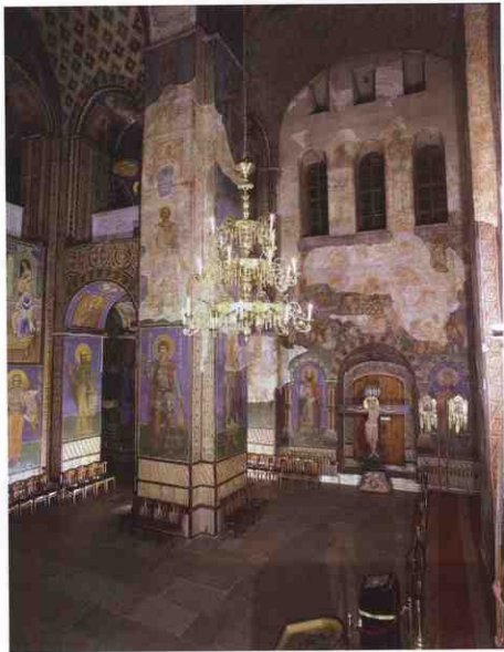
Шістнадцята частина храму