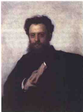
Адріан Прахов. Портрет роботи І. Крамського

в византийское искусство”, що виявилось в руських написах, в “особенностях сочинения фресок” (житійний цикл Св. Кирила Александрійського, руський костюм “царя”) тощо.