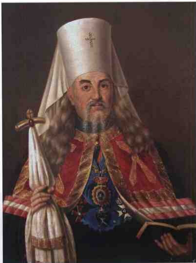
Митрополит Серпійон (Александровський)

Інженер Шліхтер за завданням влади склав навіть проект, який намітив перегородити церкву (замурування однієї з арок), запровадити часткове опалення тощо. З цієї ідеєю погодився і генерал-губернатор Д. Бібіков — "верховний" представник київської влади. Від такого "малого армагедону" старовинну святиню врятувала... відсутність коштів для будівництва (кошторис становив