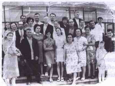
Колектив працівників елеватора, 7 липня 1974 р.

2004 р. Із села Водяне до поточної лінії Девладівського елеватора підведено газ.