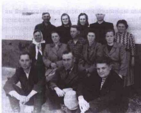
Колектив бухгалтерії елеватора, 70-ті роки

За період діяльності елеватора керували ним директори: