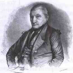
Казимир Мільбахер (1784—1865)

В період австрійського урядування окружний староста володів усією повнотою влади. Яскравий приклад — епізод з Казимиром Мільбахером. У 1823 році на той час губернського секретаря відіслано зі Львова до Стрия, де він починає виконувати обов'язки Стрийського окружного старости чи крайсгауптмана. Його попередник одержав підвищення і перебрався на Буковину. У штаті установи перебували комісари Франц фон Зальцгейм, Крістіан фон Коделлі, Йозеф Вернер і Моріс Драцький, секретар Адольф Антон граф Лавалетте, лікар, ветеринар, інженер і достатньо чиновників нижчого рівня. Отримавши ранг радника у 1824 році, староста жваво взявся за роботу. Дороги, виробництво свічок, сіль і податки — справ вистачало. У розпалі діяльності Мільбахер отримує листа від новопризначеного губернатора Людвіга Патрика Таафе. Виявляється на нього поскаржився колишній секретар магістрату Стрия Ігнатій Ашер, мовляв його незаконно обклали податком, тож треба розібратися. Справа дійшла і до цісаря Франца I, який заохочував практику «таємних листів», Йоган Вільмут звинуватив Мільбахера в аморальній поведінці.