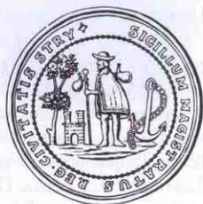
Печатка магістрату міста Стрия