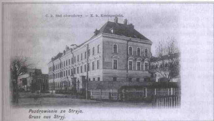
Будівля Окружного суду урочисто відкрита у жовтні 1897 року. Проект архітектора Франциска Сковрона (1856-?) втілив місцевий будівничий Юзеф Турек під керівництвом інженера Будзинського.