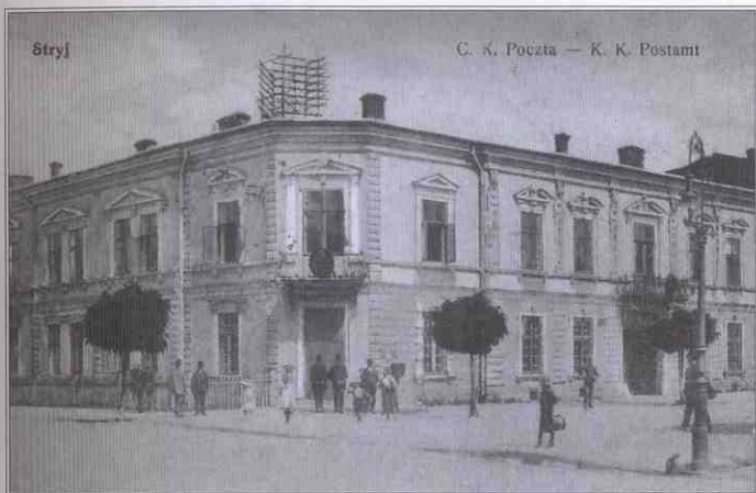
Будівля пошти кінця XIX ст. (будівничий Юзеф Турек)