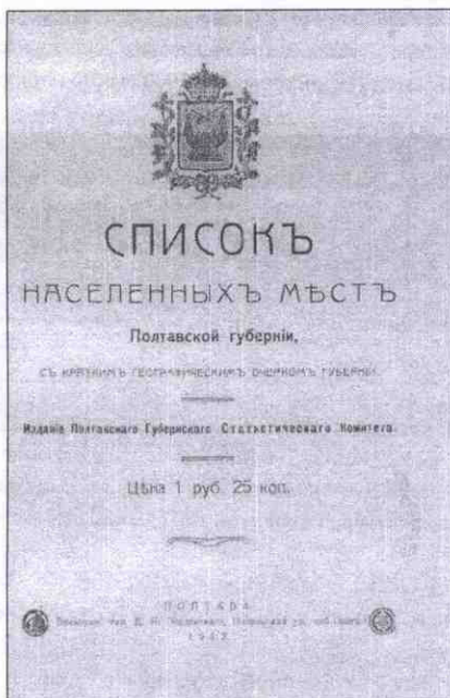
Рисунок 13 – Список населених місць Полтавської губернії (1912 рік, титул)

Серед інших друкованих письмових джерел, де вказується на існування населеного пункту Лукашівка, є список населених місць Полтавської губернії 1912 року [14]. У ньому виконано групування населених місць за належністю до тієї чи іншої адміністративної одиниці країни. Зокрема, у Кременчуцькому «уезді» Кринківській волості розташовані поселення «Лукашевка» та «Новоселовка» (рис. 13, 14).