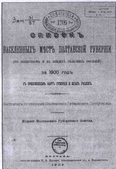
Рисунок 10 – Список населених місць Полтавської губернії (1900 рік, титул)

Зокрема, у Кременчуцькому «уїзді», Кринківській волості розташовані поселення «Лукашовка» та «Новоселовка» (рис. 10–12), де загалом проживало на той час 380 жителів (160 – у Лукашовці та 220 – у Новоселівці).