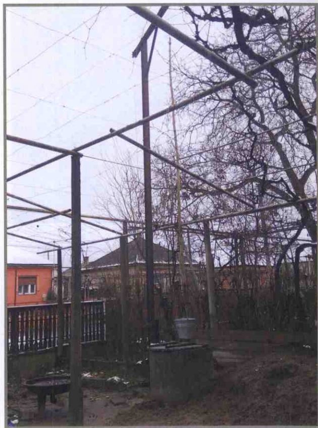
Колодязь із журавлем