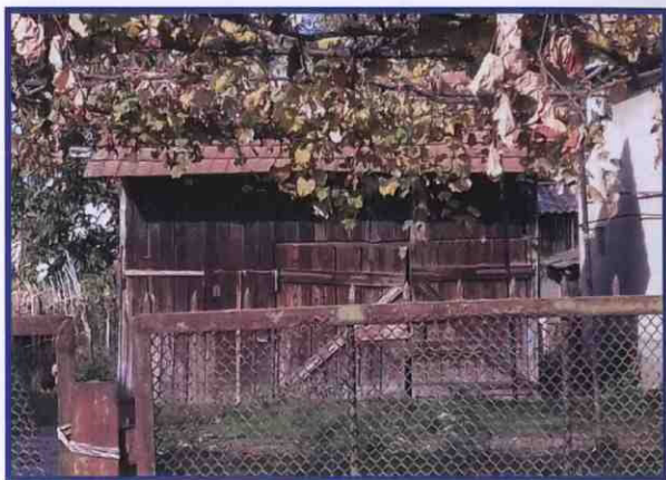
Шопа у дворі