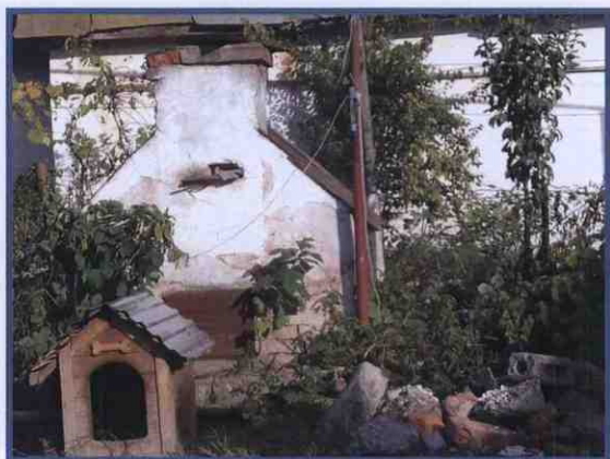
Піч у дворі