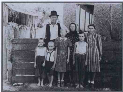
Чоловік у «пуслику» й «кресані»