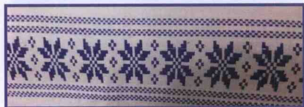
Скатертини з домотканого полотна, оздоблені набіруванням