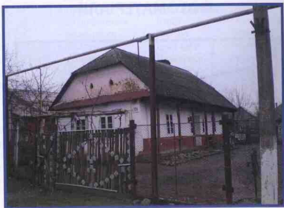
Хата з неогородженою «пудхыжою»