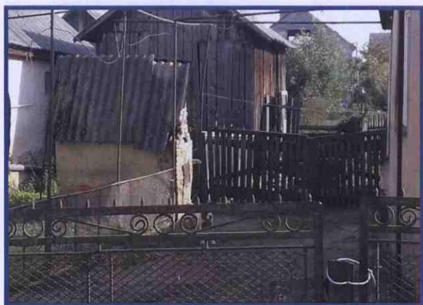
Піч у дворі. Позаду – шопа