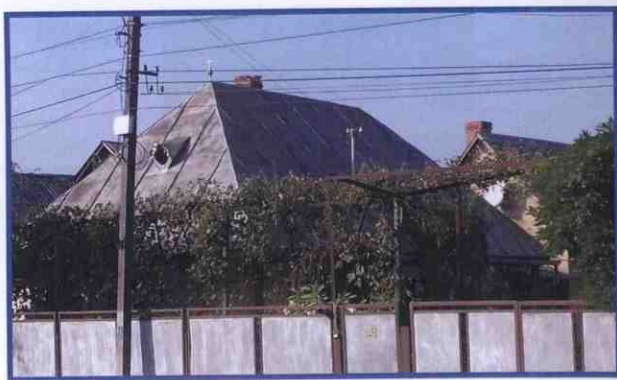
Хрестик на даху