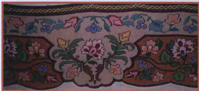
Вишивані настінні килимки