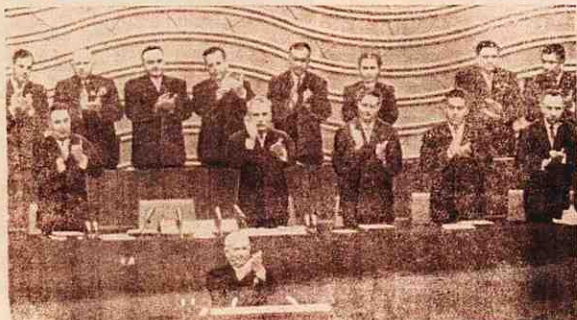
МОСКВА. В президії ХХІ з'їзду КПРС. На трибуні — Перший секретар ЦК КПРС товариш М. С. ХРУЩОВ. (Фотохроніка ТАСС).

Хай живе велика КПРС — організа- тор усіх перемог радянського народу!