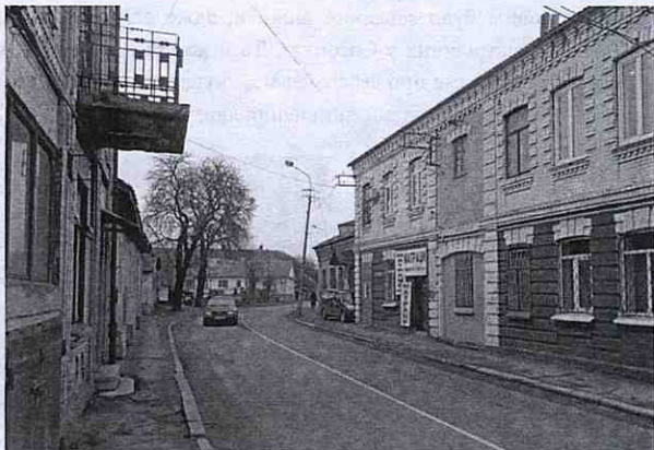
Сучасний вигляд вулиці Дорошенка, яка в час Голокосту була частиною рівненського гетто