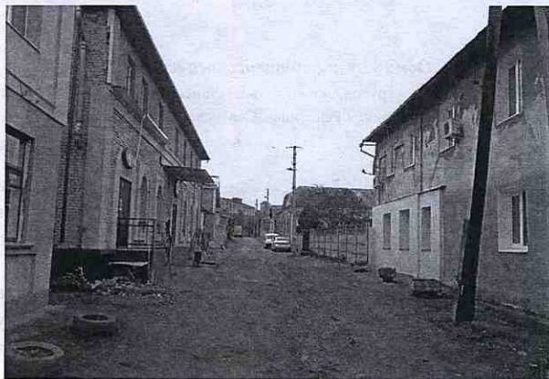
Сучасний вигляд вулиці Воля, яка в час Голокосту була частиною рівненського гетто