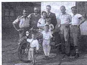
Перші мотоциклісти в Заліщиках

Українське туристично-краєзнавче товариство "Плай" організовувало на початку серпня 1935 р. т. з. "мандрівку на запашнім Поділлі". До участі в цьому туристичному зборі запрошувалися всі українські товариства, що займалися "мандрівництвом" (туризмом). Етапом цієї подорожі був водний шлях Дністра Галич – Заліщики. Мандруючи зі Львова – Станіслава – Бучача залізницею, через Бучаччину, Чортківщину туристи направлялися пішки до Кривчого, а звідси теж пішки прибували до Заліщиків. Після знайомства з містом і околицями Дністром направлялися моторним човном до Галича. Така мандрівка тривала 10 днів. Той самий шлях долали ті, хто починав мандрівку від Заліщиків на моторці по Дністру. Ще один туристичний маршрут у 1935 р. пролягав через Заліщики для мандрівників на мотоциклах, котрі виїжджали з Перемишля і через Стрий – Станіслав – Городенку – Заліщики доїжджали до Кривчого.