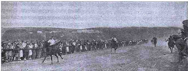
Миттєвості кінних перегонів

Саме це товариство за 2 роки організувало створення іподрому КОП в Заліщиках. Іподром був збудований у 1936-1937 рр. досить фахово з плацом для виїздки і біговою доріжкою, незважаючи на короткий час і ґрунтові особливості – глиниста земля. Тут відбувалися змагання і кінні перегони. Коней привозили з Варшави.