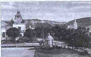
Фрагмент Заліщиків. Зліва – тенісний корт

Спортивне життя міста Заліщики також має свою історію. Організовувалося воно в процесі розвитку і становлення різних громадських товариств і формувань, що мали в арсеналі форм своєї діяльності залучення молоді до занять фізкультурою і спортом. Це були українські товариства "Сокіл", "Луг", "Січ", "Просвіта", "Рідна школа", польські – "Стшельци", "Соколи", харцери, а також молодіжні єврейські організації. Кожне з них у тій чи іншій мірі популяризувало та залучало заліщицьку молодь до спортивних вправ, ігор і змагань. Популяризаторами спорту виступали і численні гості міста, відпочивальники, туристи, екскурсанти та інші ентузіасти мандрівок. Тож з огляду на те, що Заліщики вже від початку ХХ ст. поступово стають курортним містечком, заняття різними видами спорту з часом теж набуває певної популярності. Різні спортивні змагання, у тому числі й за участю спортсменів з інших міст, були й в програмі масових заходів, що проводилися в період традиційного "Свята винозбору" в 30-х роках. А ще одним із чинників розвитку окремих видів спортивних змагань і вправ було одвічне суперництво, хай мирне, але завзяте української, польської та єврейської молоді, що відображало традиційний національний склад нашого міста та села Старі Заліщики.