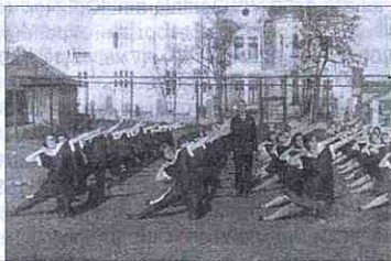
Заняття гімнастикою у школі

З ініціативи заліщицької фі-лії К.Л.К. у 1937 р. в Заліщиках відбулися цікаві спортивні зма-гання під назвою "Біг навпрос-тець" (вид легкоатлетичної дис-танції в 30-х роках – біг на 1-3 км через поля, луки, ліси і т. п.).