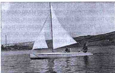
Яхтинг на Дністрі

ках. Так, з 15 по 30 вересня 1937 р. в час свята винобрання відбувалися різні спортивні заходи на воді: змагання рибалока, плавців, веслувальників на байдарках та рибальських човнах. 17 вересня відбулося закінчення загальнопольського сплаву, організованого Львівським округом Польської Спілки Човнярів.