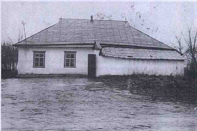
Приміщення старої школи.

В 1912 році було збудовано нове приміщення школи на кошти Святейшого синоду, який «пожалував» на це 3000 карбованців.