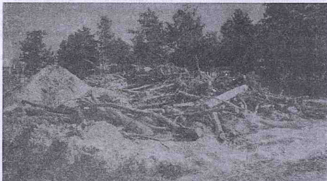
Залишки Мирівських могил.

В 1915 р. в село прибула експедиція Київського товариства по дослідженню стародавніх матеріальних пам'яток. Її учасники розкопали дві могили. В першій знайшли скелет людини з залізним ножом і великий наконечник стріли, а також череп коня з залізними вудилами в зубах.