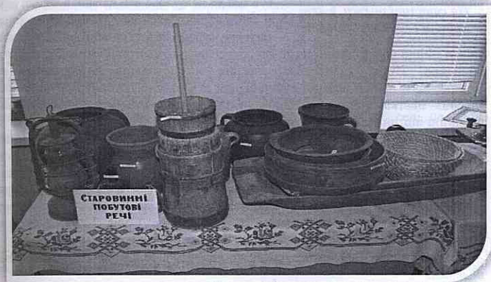
На світлині старовинні побутові речі, домашня утвар

На полях в пд.-сх., околиці села знайдено крем'яні уламки сокири з відшліфованою поверхнею, наконечники списів, серпів, пластини, відщепи, які використовувалися в господарстві.