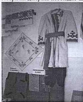
На світлині одяга, у якій ходили селяни с. Метенів

Тим часом повернемося до теми нашої розмови про славний Метенів. Прадавню історію Метенева описати можна хіба що, як кажуть з «голови». Історичні джерела необхідно шукати в Всеукраїнських бібліотеках, Львівських літописах ін. Ми скористаємося доступною нам інформацією і, зокрема, результатами наших попередніх досліджень, які були присвячені Метеневу і козацькій добі.