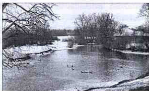
Тихоплинна Стрипа під весну місяцями залишається повноводним водоймцем

Повернувшись додому, Оленка негайно розповіла про випадок зустрічі з турком батькові. Він, у свою чергу, стривожений можливою крадіжкою доньки, наказавши їй закритись і не виходити з хати, без усяких пересторог зайшов і про все розповів старості села. Староста і батько вирішили поспілкуватись з Оленкою разом. Вона була на диво спокійною і розповідала про зустріч з турком без страху і, навіть, з якимось захопленням, знову повторивши, що він такий, як і наші хлопці.