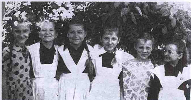
Третьокласниці Жовтневої школи. 1968 р.