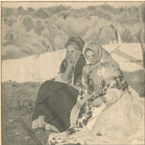
О. Мурашко. У неділю. 1909 р.