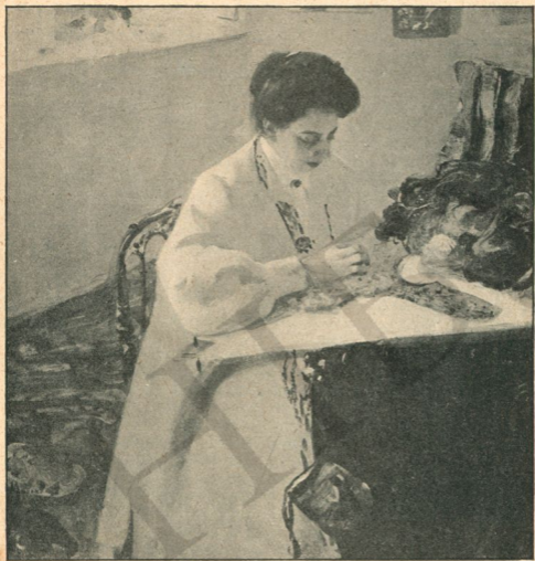
О. Мурашко. Е. Пр... за працею, 1908 р.