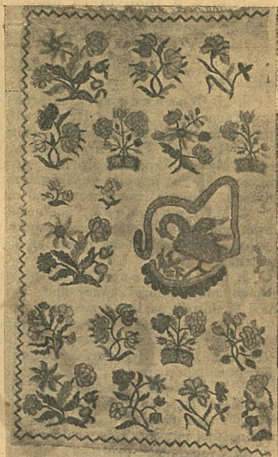
5. Килим, в рослинну композицію якого уведено пелікана.

Заснований в грудні року 1921, Союз-Кустар за такий, порівнююче короткий термін, вже об'єднав навколо себе 140