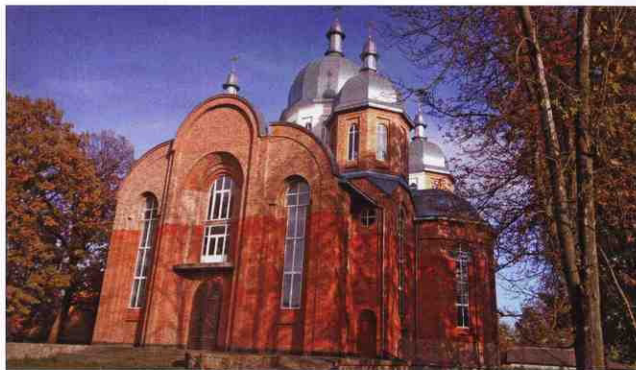
Церква Всіх святих Українського народу