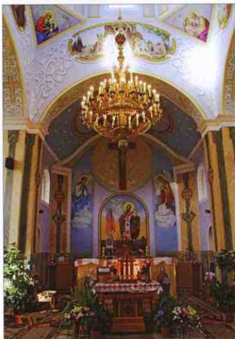
Внутрішнє оздоблення церкви святого Василя Великого