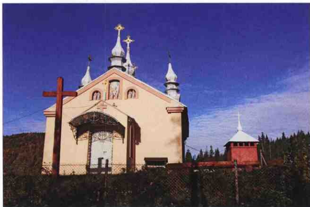
Церква святого Великомученика Юрія