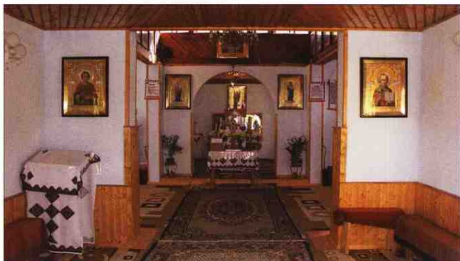
Внутрішнє оздоблення храму Архистратига Михаїла та св. Йосафата