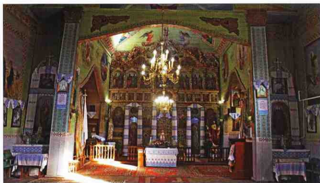
Внутрішнє оздоблення церкви Різдва Пресвятої Богородиці