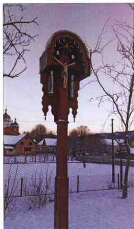
Хрест-фігура біля церкви Різдва Пресвятої Богородиці