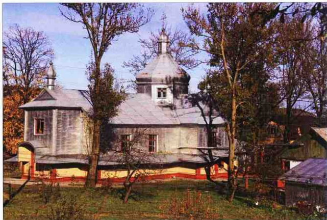
Церква Різдва Пресвятої Богородиці