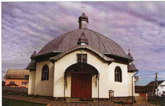
Церква Пресвятої Трійці