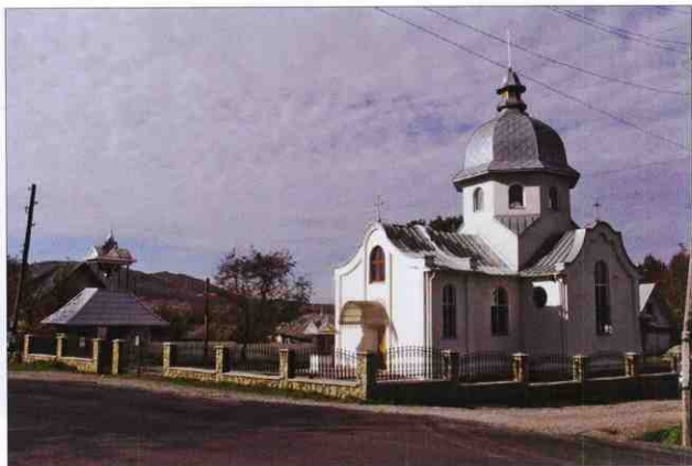
Церква святого Василя Великого