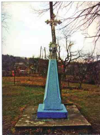
Хрест біля церкви Різдва Пресвятої Богородиці