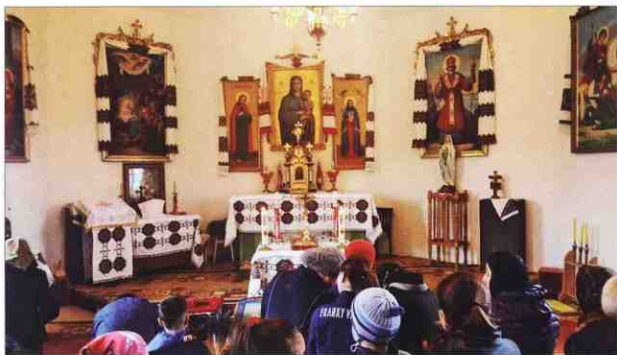
Внутрішнє оздоблення церкви святого Великомученика Юрія