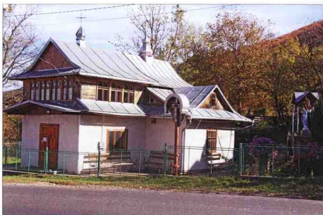
Храм Архистратига Михаїла та св. Йосафата