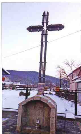
Хрест, збудований в пам'ять жертвам Голодомору