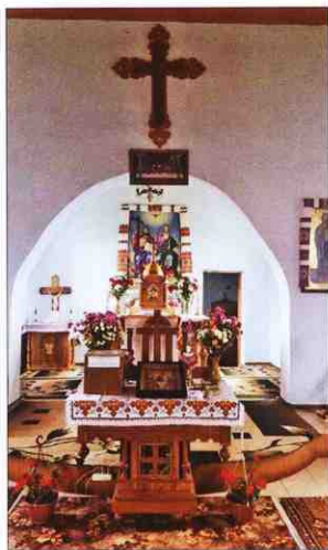
Внутрішнє оздоблення церкви Пресвятої Трійці