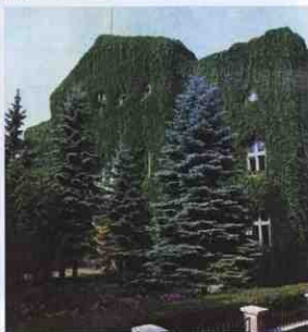
Міська рада. 1960-ті рр. ▶