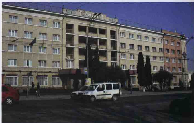
▲ Готель «Тернопіль» (вул. Замкова, 14). Фото 2011 р.