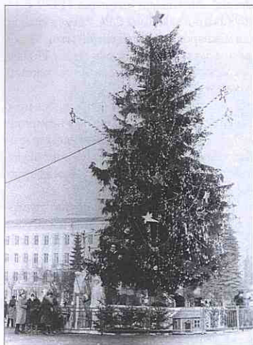
Головна ялинка міста на Театральному майдані.

Під Новий 1960 рік головну ялинку міста поставили в центрі Театральної площі. Відтоді в Новорічну ніч вона притягувала тисячі тернополян. Танці, співи, музика, гамір під вибухи хлопавок і шампанського продовжувалися до ранку. Мало хто звертав увагу на неграмотний заклик-суржик біля ялинки — «Добро пожалувати!» Українське «Ласкаво просимо!» з'явилося пізніше. На жаль, ялинку до Різдвяних свят з площі прибрали.