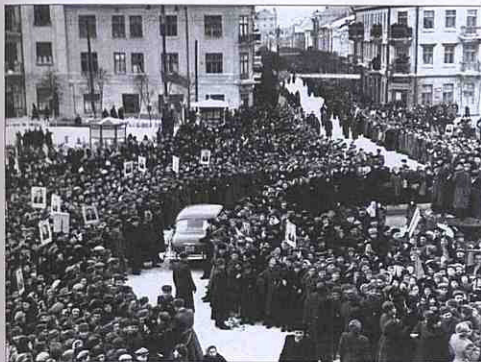
Зустріч М.С. Хрущова на Привокзальній площі. 10.12.1959 р.