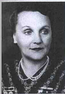
Артистка Наталія Ужвій (1898–1986).

Протягом 1959 року тернополяни, після тривалої перерви, мали змогу побачити і почути творчість національних колективів і виконавців. У лютому — гастролі Державного українського народного хору (художній керівник та головний диригент Григорій Верьовка). З 2 по 14 червня в приміщенні обласного драмтеатру — гастролі Львівського драматичного театру Радянської Армії. У травні в Будинку культури виступав Ансамбль пісні, музики і танцю з Мельниці-Подільської (художній керівник Василь Зуляк). 27 липня на сцені обласного драмтеатру почав свої гастролі