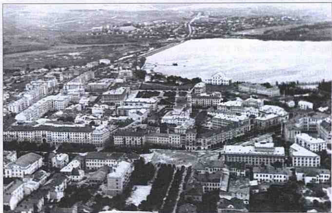
Вид на центральну частину міста. Аерофотозйомка. 1959 р.