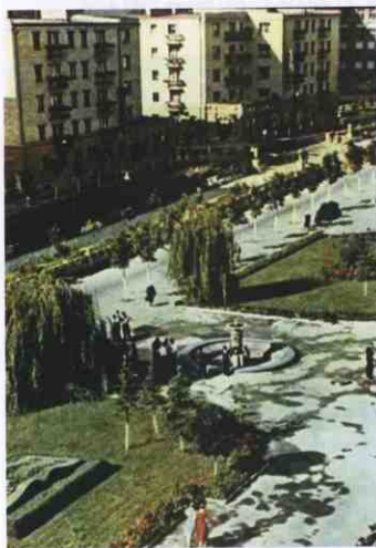
▲ Сквер перед Кооперативним технікумом. 1959 р.