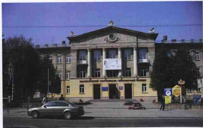
▲ Кооперативний коледж (вул. Руська, 17). Фото 2011 р.