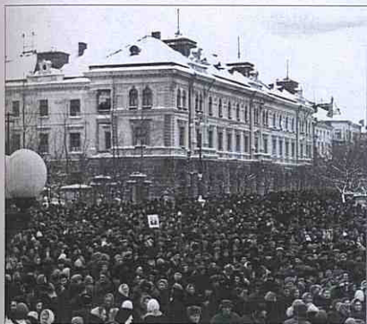
Зустріч М.С. Хрущова на Театральній площі. 10.12.1959 р.