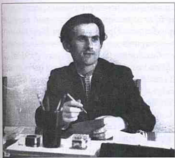
Поет Борис Демків (1936–2001).

(1936–2001) народився і жив у Тернополі. Закінчив середню школу робітничої молоді (1956 р.), потім факультет журналістики Львівського університету імені І. Франка (1973 р.). Друкуватися почав з 1960 року. Автор збірок поезій: «Сувола ніжність» (1965), «Символи» (1968), «Червоне мовчання» (1972), «Крило зорі» (1978), «Дерево життя» (1982), «Поезії» (1986), «Ораторія лісу» (1987), а також збірки пісень «Квіти ромена» (1995).