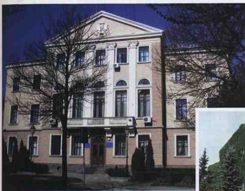
▲ Міська рада (вул. Листопадава, 5). Фото 2011 р.