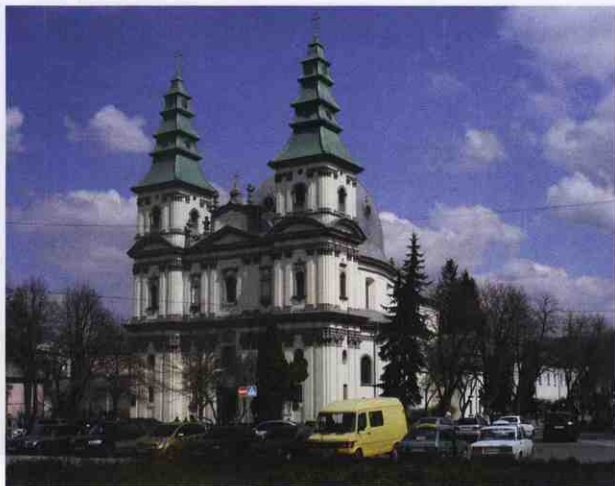
▲ Собор Непорочного Зачаття Пресвятої Діви Марії УГКЦ (кол. Домініканський костел; вул. Гетьмана Сагайдачного, 14). Фото 2011 р.