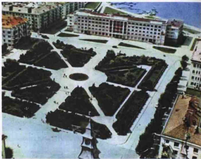
▲ Вид на пл. Свободи з готелем «Тернопіль». Аерофотозйомка 1959 р.