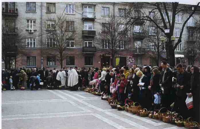
▲ Освячення великодніх пасок біля Катедрального собору УГКЦ. Фото 2011 р.