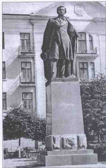
Пам'ятник А.С. Пушкіну (навпроти будинку КГБ). 1959 р.

12 квітня сотні тернополян (учні, студенти, робітники) вийшли на неділля — садити дерева у лісопарку на кутковецькому горбі. Молодь працювала майже п'ять годин і висадила 12 тисяч дерев. Восени, на черговому неділляку, було висаджено ще 12 тисяч. Згодом всі парки, лісопарки, сади, над упорядкуванням яких працювала молодь, офіційна пропаганда почала називати «комсомольськими». Дійшло до того, що й Тернопільський став отримав осучаснене ім'я — «Комсомольське озеро».