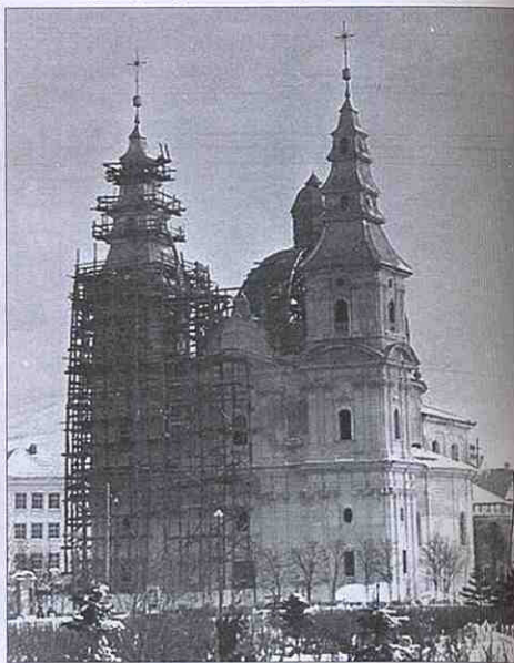
Реставрація Домініканського костелу. Зима 1959 р.