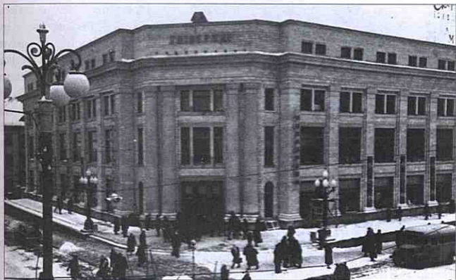
Центральний універмаг. Грудень 1959 р.

одного сезону перевершив існуючі до нього обласні рекорди в бігу на 1 500 і 5 000 метрів, 3 км з перешкодами, увійшов до десятки найкращих бігунів України. Його вихованець Руслан Дяченко на VII Всесоюзній спартакіаді школярів (1959 р.) у бігу на 800 метрів зайняв перше місце і здобув звання чемпіона СРСР серед юнаків.