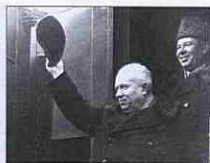
М.С. Хрущов у Тернополі. Справа — М.В. Підгорний. 10.12.1959 р.