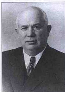
Перший секретар ЦК КПРС М.С. Хрущов (1894–1971).

10 грудня в другій половині дня перший секретар ЦК КПРС, Голова Ради Міністрів СРСР М.С. Хрущов відвідав Тернопіль. Він повертався з Будапешта, де брав