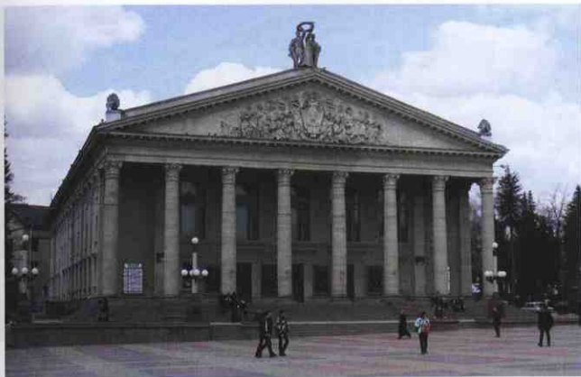
▲ Обласний академічний драматичний театр ім. Т. Шевченка (бульв. Т. Шевченка, 6). Фото 2011 р.