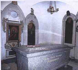
Саркофаг Рум'янцева С. П. Сучасне фото

З початку XIX сторіччя назва села – Городище – у документах більше не