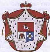
Родовий герб Голіциних

Наступним власником Ташані був князь Микола Павлович Голіцин (06.09.1814–11.10.1886) – син князя Павла Олексійовича Голіцина (08.12.1782–21.12.1849), дійсного статського радника, та Варвари Сергіївни Кагульської (04.01.1791–24.08.1875), незаконно народженої дочки Сергія Петровича Рум'янцева. Володів Ташанню з 1838 по 1870 рік. При ньому в парку був побудований дерев'яний палац. У 1842 році на новому сільському кладовищі коштом князя Голіцина була споруджена дерев'яна церква, освячена на честь Преподобного Сергія Радонезького (спалена в 1960-х роках) [31, стор. 158].