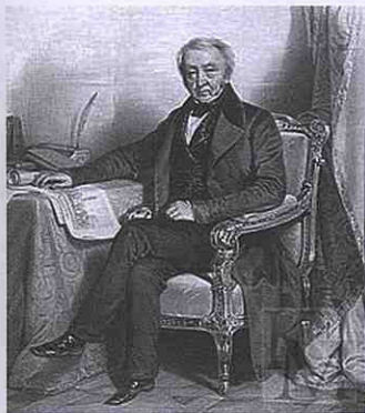
Сергий Петрович Рум'янцеv. Початок XIX ст.

тѣла убитыхъ на сраженіяхъ». Також повідомляється про проведення чотирьох ярмарків за рік [19, стор. 210, 306].