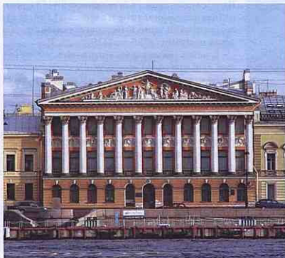
Палац Рум'янцева П. О. в Санкт-Петербурзі. Сучасне фото

хуторів Лівобережної України. Документ на той час слугував довідником, у якому подавалися відомості про розташування населених пунктів в старій полковій адміністративній системі та новій – намісницькій. Також Опис містить дані про кількість дворів, соціальний склад населення тощо [19, стор. 9].