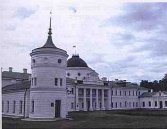
Палац Рум'янцева П. О. в селі Качанівка (Ічнянський р-н Чернігівської обл.). Сучасне фото

(25.09.1724–22.08.1779), діти – Михайло (1751–1811), Микола (1754–1826) та Сергій.