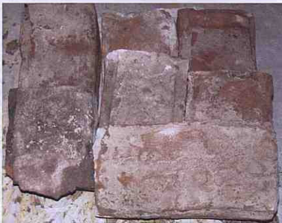
Цеглини з північного схилу городища. Знахідка 2013 р.

В обох Описах однаково зазначено, що «...подъ мѣстечкомъ Ташанью множество находится могилъ, означающихъ похороненные