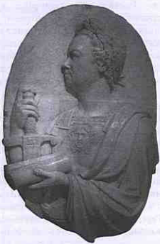
Фрагмент надгробку Рум'янцева П. О. Києво-Печерська лавра