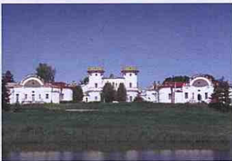
Палац Рум'янцева П. О. в селі Вишеньки (Коропський р-н Чернігівської обл.), суттєво перевбудований у XIX ст. Сучасне фото