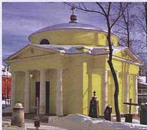
Каплиця-мавзолей Рум'янцева С. П. Сучасне фото

Граф Сергий Петрович Рум'янцеv (17.03.1755–24.01.1838) – молодший син генерал-фельдмаршала графа Рум'янцева-Задунайского П. О. Народився в селі Стряпкове Юрїївського повіту Владимирської губернії. Проживав у Петербурзі, Москві, мандрував закордоном. У 1785–1788 роках призначений послом до курфюрста Баварії, короля Пруссії, потім до Берліна, в 1793–1794 роках був послом у Швеції, в 1796–1797 роках – член колегії іноземних справ, в 1797–1799 – Міністръ уѣзловъ Російської імперії, в 1802 та з 1805 по 1838 роки – член Державної Ради, з 1810 року