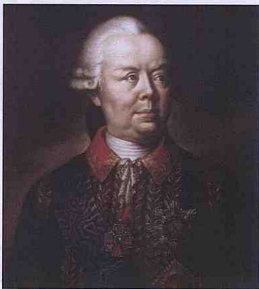
Петро Олександрович Рум'янець- Задунайський. Кінець XVIII ст. Невідомий художник

У 1770 році власником села Городище стає генерал-фельдмаршал Рум'янець Петро Олександрович. На честь перемоги над турками в битві на річці Кагул імператриця Катерина II нагородила графа Рум'янцева орденом Святого Георгія першого класу та подарувала багато маєтностей в Україні, серед яких було і село Городище.