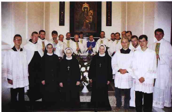
Каплиця Матері Божої Бердичівської в нижньому храмі, 2001 р.