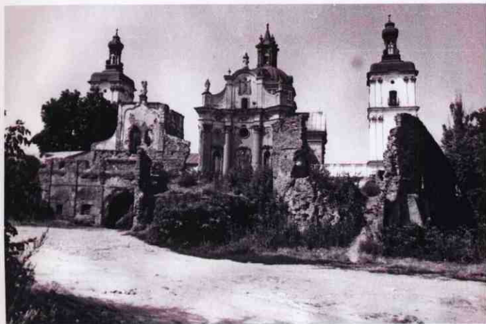
Загальний вигляд монастирського комплексу, 1993 р.