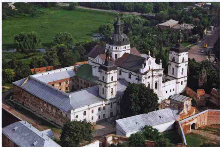
Санктуарій з висоти пташиного польоту, 2006 р.