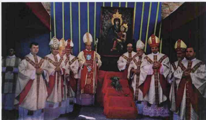
Коронація ікони Матері Божої Бердичівської, 19 липня 1998 р.