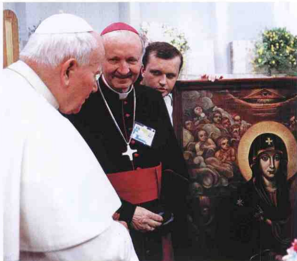
Папа Йоан Павло II освячує нову ікону Матері Божої Бердичівської Краків, 1997 р.