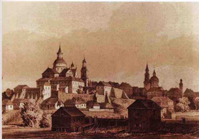
Н. Орда. Бердичів. Костел кармелітів босих і монастир 1870-1874 рр.