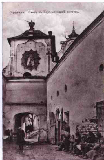
Санктуарій Матері Божої Святого Скапулярію Листівка початку XX ст.