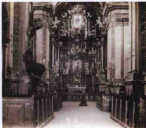
Інтер'єр верхнього храму, 1918 р.