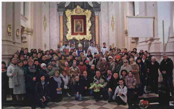
Паломники біля ікони Матері Божої Бердичівської, 2017 р.