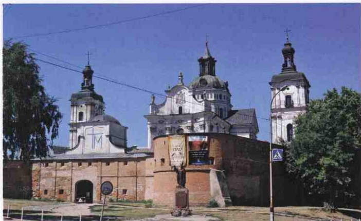
Загальний вигляд Санктуарія, 2015 р.