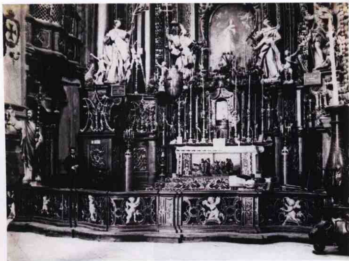
Головний вівтар, 1918 р.