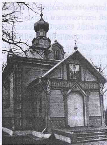
Храм Вознесіння Господнього, 1865 р. в с. Яревищах, побудований на монастирському кладовищі, фото 60-ті рр. ХХ ст.