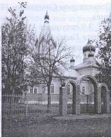
Храм Покрови Богородиці, 1902 р. в с. Дубечно, фото 13.10.2007 р.