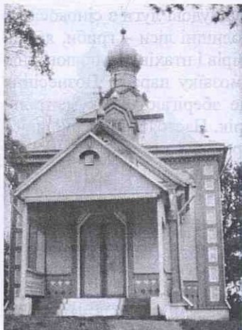
Храм Вознесіння Господнього, 1865 р. в с. Яревищах, побудований на монастирському кладовищі, фото 1995 р.

По Першій світовій війні, революції, українських національно-визвольних змаганнях 1917–1921 рр. «біженці» повернулися до рідних домівок, розпочалась відбудова поруйнованих господарств. Наші землі на той час були вже окуповані поверсальською Польщею і новий окупант počував себе господарем на нашій землі.