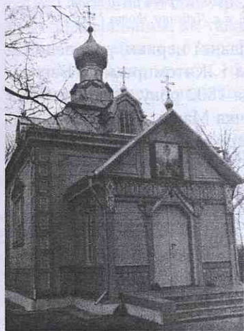
Храм Вознесіння Господнього, 1865 р. в с. Яревищах, побудований на монастирському кладовищі, фото 1990 р.

За документальними джерелами ДАВО в селі Яревищах, Кримненської волості, Володимирського повіту у 1844 році налічувалось дворів – 46, парафіян: чол. – 184, жін. – 193 [17; арк. 182].