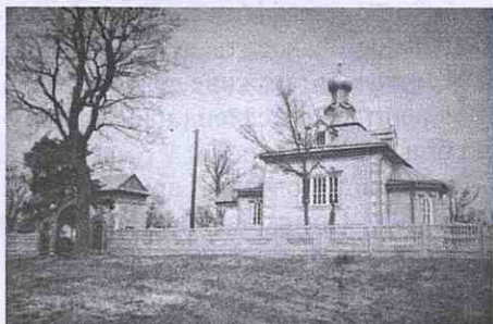
Церква Вознесіння Господнього, 1865 р. в с. Яревище, фото 07.04.2005 р.

в селах хат-читалень: 1925 р. – 20, 1926 р. – 58, 1927 р. – 97; вистав – 268, свят Тараса Шевченка – 30, Івана Франка – 11, Просвіти – 2, відчитів у повіті за ці роки – 99, в Ковелі – 9, разом – 105; полагоджено різних просвітенських справ: 1925 р. – 492, 1926 р. – 1240, 1927 р. – 2610. Добре зорганізовані просвітянські хори: у місті Ковель, селах: Седлище, Облапи, Любитів, містечках: Турійську, Матієві; за допомогою «Просвіти» постало 11 кооперативів [33; арк. 1].