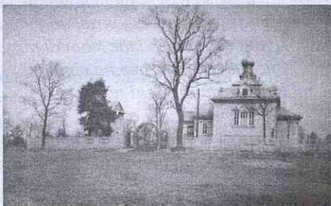
Церква Вознесіння Господнього, 1865 р. в с. Яревище, фото 07.04.2005 р.