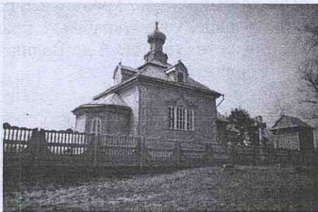
Церква Вознесіння Господнього, 1865 р. в с. Яревище, фото 07.04.2005 р.

— 1962 року храм Вознесіння Господнього в с. Яревищах знято з реєстрації, — читаємо в