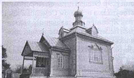
Храм Вознесіння Господнього, 1865 р. в с. Яревище.