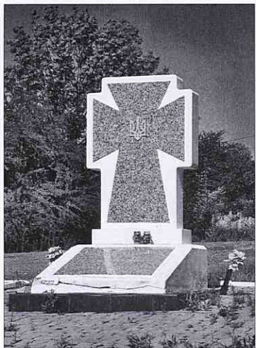
Борцям за волю України