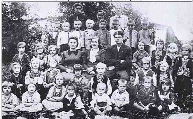
Коропузький дитсадок, 30-ті роки