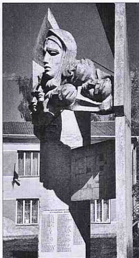
Загиблим під час II Світової