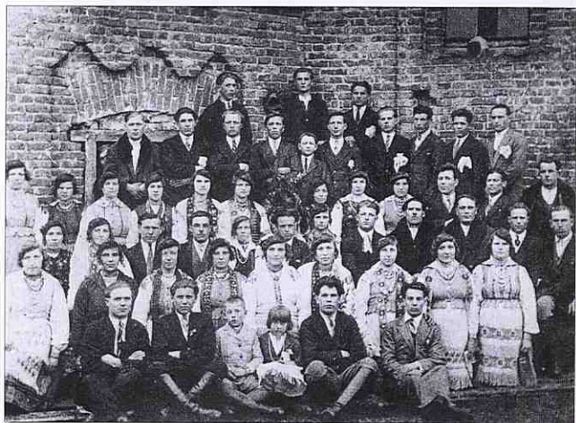
Один із Коропузьких хорів