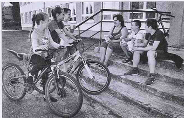
Канікули у місцевих школярів...