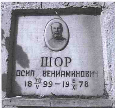
Урна с прахом в колумбарии Востряковского кладбища