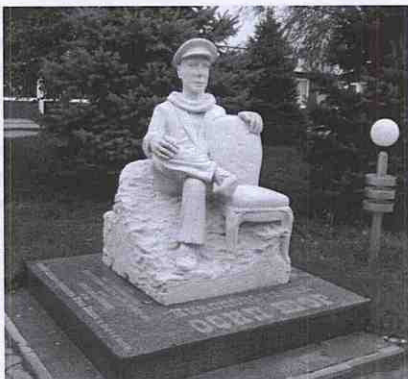
Памятник Остапу Бендеру в Никополе