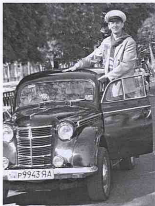
Командовать парадом буду я!