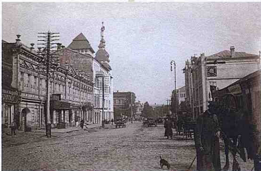
The final stage of the construction. The facade facing Katerynynskiy Ave. and Pervozvanivska Str., August, 1913