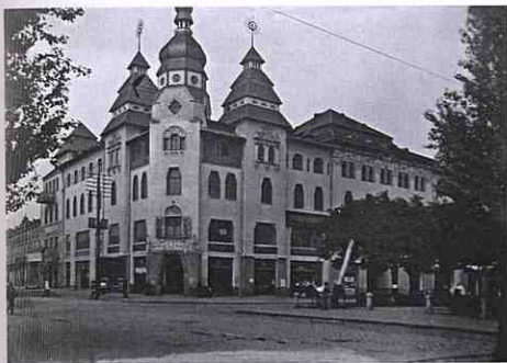
Будинок у завершеному вигляді. Орієнтовно 1914-1917 рр.